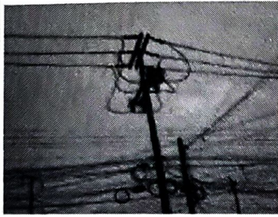
ภาพที่ 1 ก่อนการแก้ไข (ภาพจริง)

กฟฟ. กฟฟ. ล้อมล้อม สถานีไฟฟ้า ล้อมโหนด 2 (OYK) ระบบ 22KV วงจร 07VB01 จาก OYK75-01 - ถึง SF6 OYK75 -03 ระยะทาง (วงจร-กม.) Z ข. 3หมอนา ปักชอลดลนทวาม