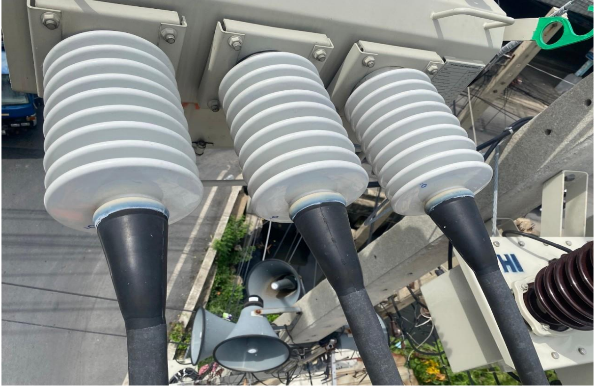
OND09S-02 Type B