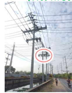
พื้นที่ก่อสร้าง สฟฟ.กระท่อมแบน 6