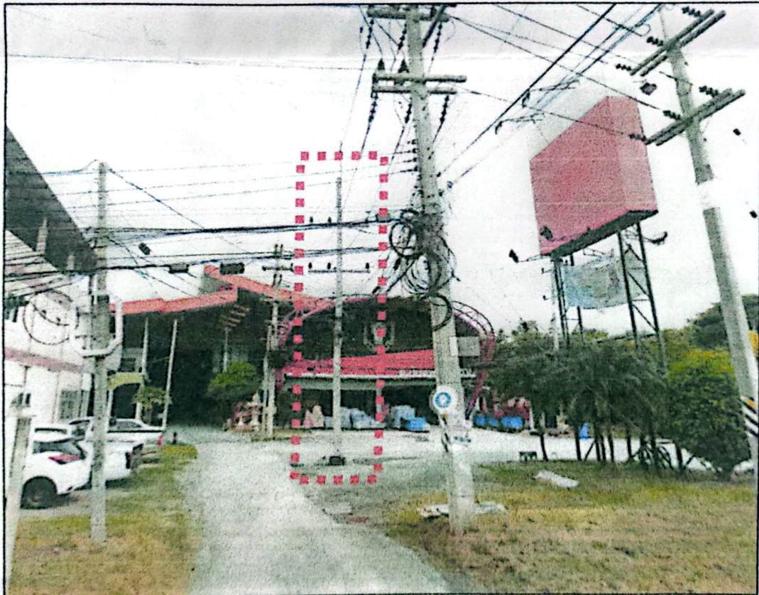
เสาไฟฟ้าของการไฟฟ้าส่วนภูมิภาค (จำนวน ๑ ต้น) ติดขัดการก่อสร้างที่ กม.๐+๐๐๒ ด้านซ้ายทาง